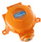
Detectores de gases estándar de la industria