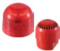
Sirenas y balizas, opciones de área segura, intrínsecamente seguras o a prueba de llama