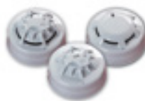
Hasta 20 detectores de fuego/ calor por zona