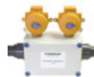
Control de ventilador para unidad de muestreo medioambiental de Crowcon

Crowcon se reserva el derecho de cambiar el diseño o a las especificaciones del producto sin notificación previa.