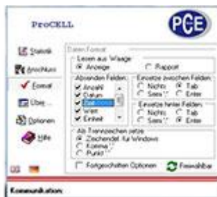
Software ProCell para la balanza para paquetería USB