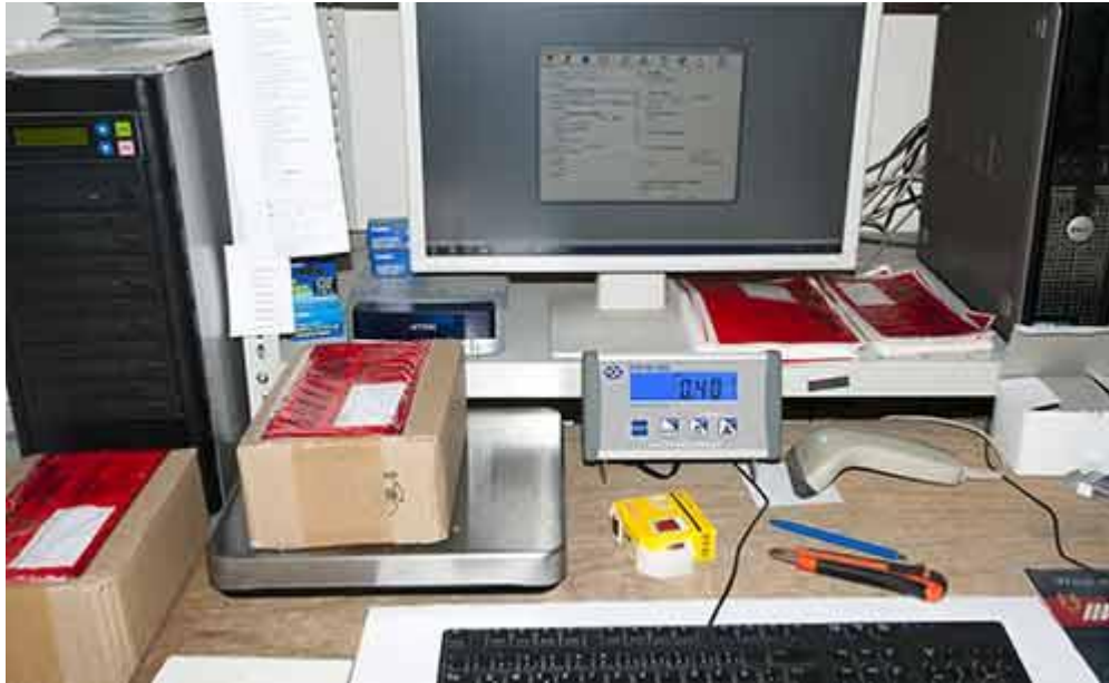
Balanza para paquetería de la serie PCE-PB N con USB en combinación con DHL