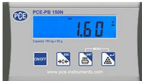
Pantalla de la balanza para paquetería USB de la serie PCE-PB N