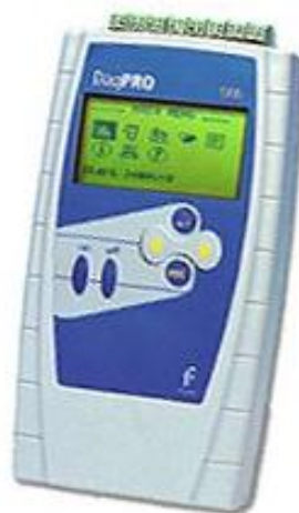
Registrador de datos Daq Pro