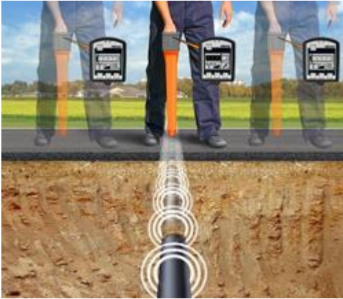
El detector de cables EasyLoc localizando una línea bajo tierra