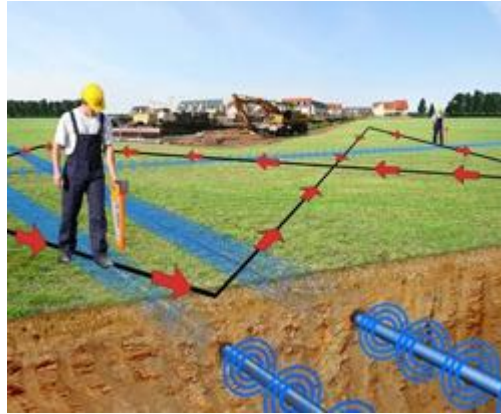
El detector de cables EasyLoc comprobando un terreno.