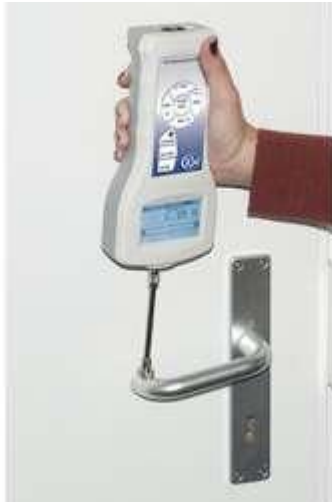
Dinamómetro de precisión PCE-FB con célula de carga interna para fuerzas de tracción y compresión