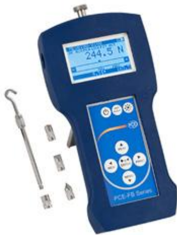
Dinamómetro de precisión PCE-FB con célula de carga interna