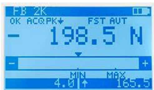
Pantalla del dinamómetro con información como fecha, hora, estado de batería, velocidad de medición, fuerza y valores máximo y mínimo