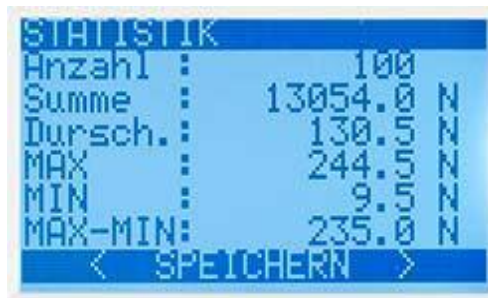
8 posiciones de memoria, que individualmente pueden ser identificadas, de 800 mediciones