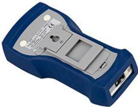
Parte posterior del dinamómetro de precisión. También se puede apreciar el compartimento de la batería del dinamómetro