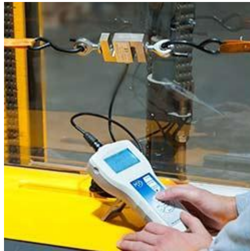
Dinamómetro de precisión PCE-FB K con célula de carga externa para fuerzas de tracción y compresión