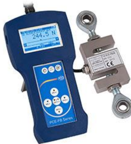
Dinamómetro de precisión PCE-FB K con célula de carga externa