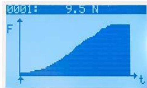
Representación de las mediciones en formato de diagrama, con posibilidad de consultar datos registrados por el dinamómetro individualmente