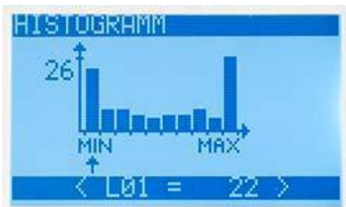
Presentación de la distribución de frecuencia del dinamómetro PCE-FB