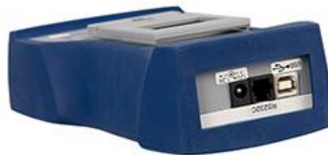
Aquí se pueden observar las conexiones del dinamómetro de precisión para fuerzas de tracción y compresión