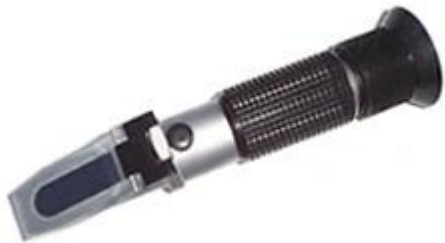
Aparato para contenido de sal en alimentos Refractómetro PCE-028

Con este aparato puede determinar el contenido de sal de un modo rápido y preciso, así como obtener el peso específico. El refractómetro puede ser usado para medir el contenido de sal en alimentos y en todo tipo de soluciones con concentración de sal. Esto es importante por ejemplo en el sector de la industria de la alimentación. En lugar de emplear el refractómetro para medir el contenido de sal del agua o de soluciones acuosas, puede determinarlo con la ayuda de los medidores de conductibilidad digitales. Sobre ello puede informarse en nuestra página de medidores de conductibilidad electrónicos. Si tiene preguntas sobre el refractómetro para contenido de sal en alimentos consulte la siguiente ficha técnica, use nuestro formulario de contacto o llámenos: 902 044 604 para España, para Latinoamérica e internacional +34 967 513 695 o en el número +56 2 29381530 para Chile. Nuestros técnicos e ingenieros le asesorarán con mucho gusto sobre este refractometro y sobre cualquier producto de nuestros sistemas de regulación y control , equipos de laboratorio , medidores o las balanzas de PCE Ibérica S.L.