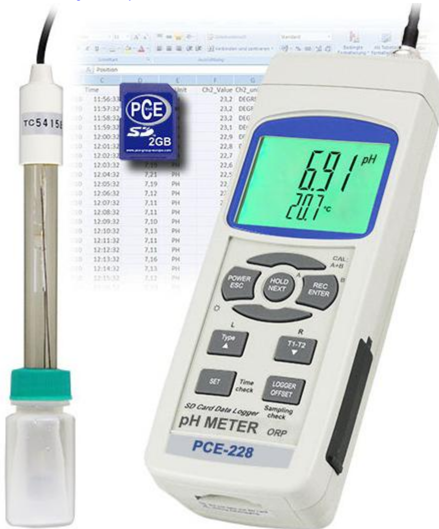
pH-metro PCE-228 con electrodo de pH PE 03