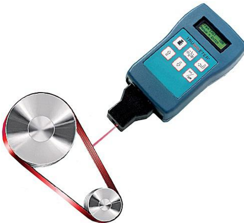
Medidor de tensión de correas de distribución Trummeter