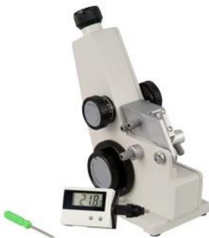
Refractómetro Abbe con el contenido del envío