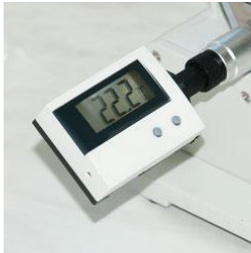
Refractómetro Abbe con un termómetro para calcular el índice de refracción correcto