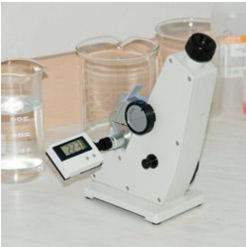
Refractómetro Abbe en su entorno habitual