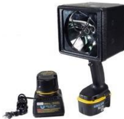
Estroboscopio con acumulador Beacon

El estroboscopio con acumulador ofrece un alto rendimiento sobre todo en la inspección y en la producción de empresas fabricantes de laminación plana, como acero, papel, textil... . Haga visibles cosas de su producción que de otro modo jamás descubriría.