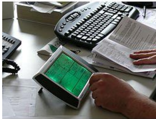
Aquí ve el manejo de la estación meteorológica PCE-FWS 20 a través de la pantalla táctil