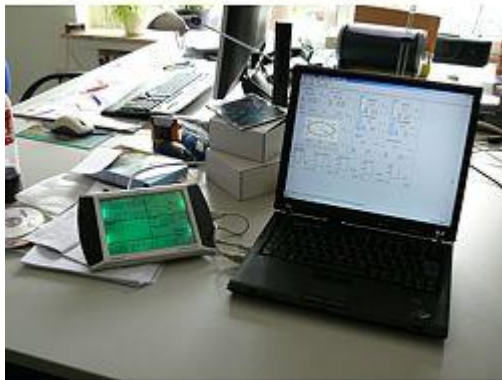
Aquí observa la estación meteorológica PCE-FWS 20 conectado a un portátil con el software