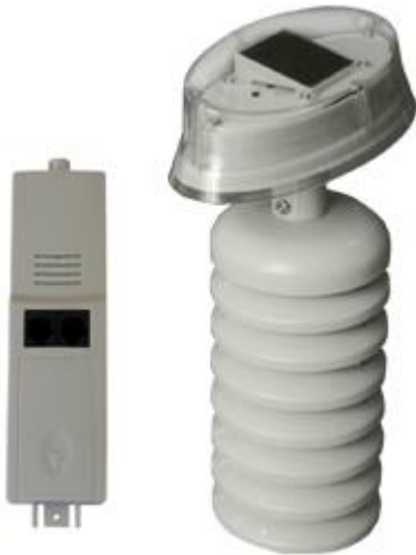
Este es el sensor de temperatura y humedad que incluye el transmisor con módulo solar