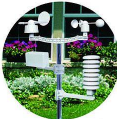
Aquí observa los sensores agarrados al mástil que se incluye en el envío.