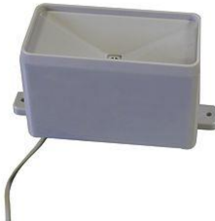
Aquí ve el sensor de pluviometría de la estación meteorológica PCE-FWS 20