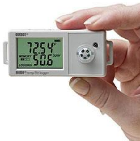
El registrador de datos compacto HOBO UX100-011 para temperatura y humedad.