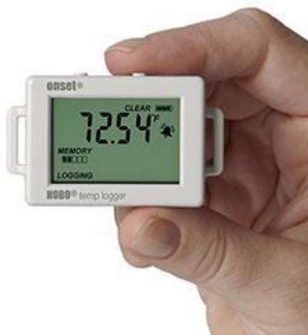
El registrador de datos HOBO UX100-001 para temperatura tiene un tamaño reducido.