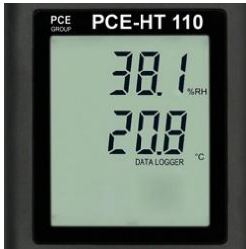
Imagen de la pantalla del logger de datos