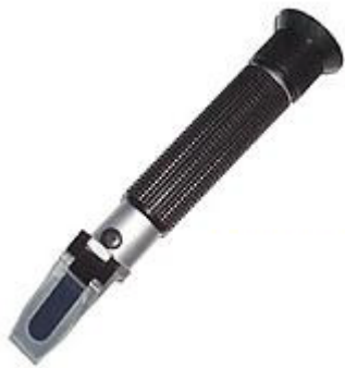
Aparato para contenido de sal Refractómetro PCE-0100

Con este refractómetro puede determinar el contenido de sal de un modo rápido y preciso, así como obtener el peso específico. El refractómetro puede ser usado para medir agua salada / agua de mar y todo tipo de soluciones con concentración de sal. Esto es importante por ejemplo en la industria alimenticia, así como en el sector de las piscifactorías. En lugar de emplear el refractómetro para medir el contenido de sal del agua o de soluciones acuosas, puede determinarlo con la ayuda de los medidores de conductibilidad digitales. Sobre ello puede informarse en nuestra página de medidores de conductibilidad electrónicos. En cualquier caso el refractómetro es más adecuado para el agua de mar, puesto que la conductibilidad es sólo una medida indirecta y así se ahorrará una conversión o correlación de valores. Si tiene preguntas sobre el refractómetro para contenido de sal consulte la siguiente ficha técnica, use nuestro formulario de contacto o llámenos: 902 044 604 para España, para Latinoamérica e internacional +34 967 513 695 o en el número +56 2 29381530 para Chile. Nuestros técnicos e ingenieros le asesorarán con mucho gusto sobre este refractómetro para el contenido de sal y sobre cualquier producto de nuestros sistemas de regulación y control , equipos de laboratorio , medidores o las balanzas de PCE Ibérica.