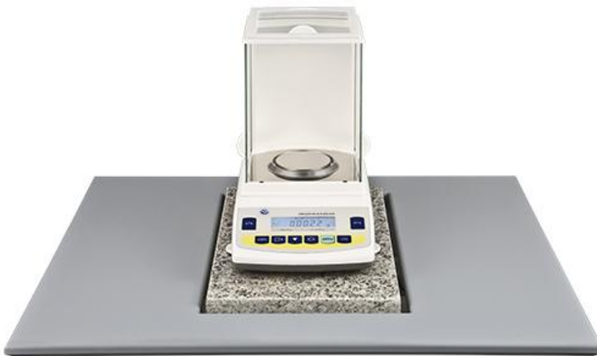
Mesa antivibración PCE-AVT 1 con balanza de análisis serie PCE-AB

Estas son las dimensiones de la mesa antivibraciones PCE-AVT 1