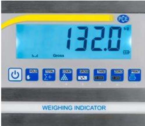
Pantalla de la balanza para pales (desmontable)