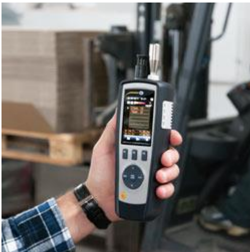
El contador de partículas PCE-PCO 2 durante una medición.