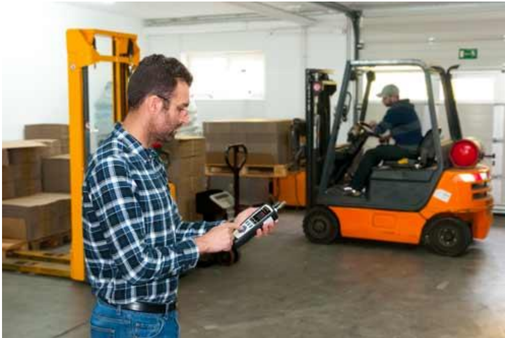
Usando el contador de partículas PCE-PCO 2 en un almacén.