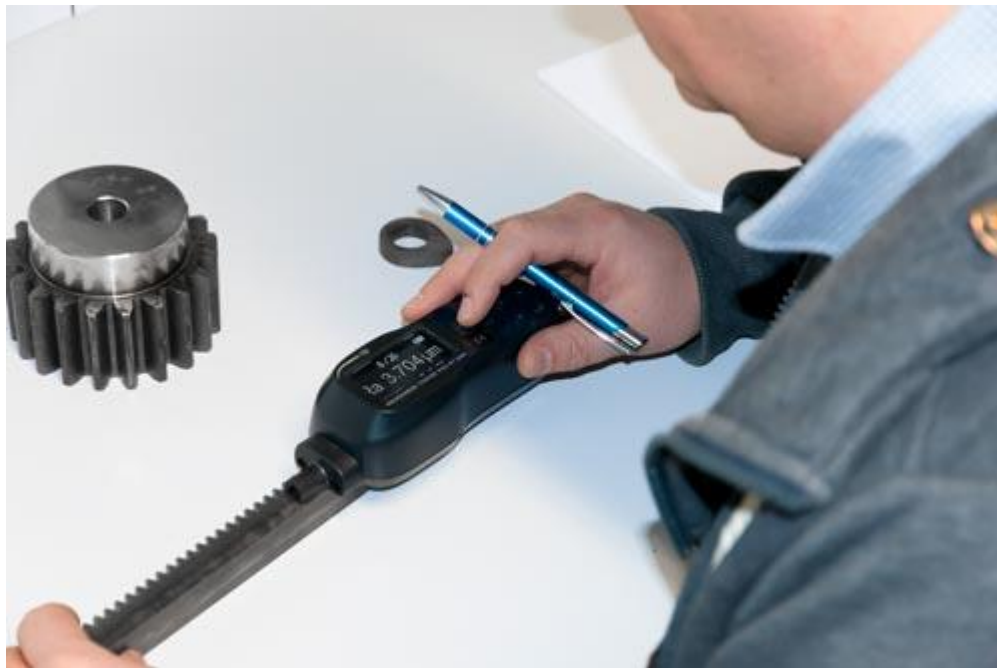
Una medición realizada con el rugosímetro PCE-RT 1200.