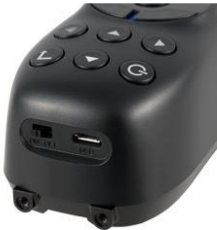
El rugosímetro dispone en un lateral de una interfaz USB.