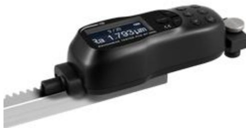
Aquí se aprecia la estructura completa del rugosímetro PCE-RT 1200.