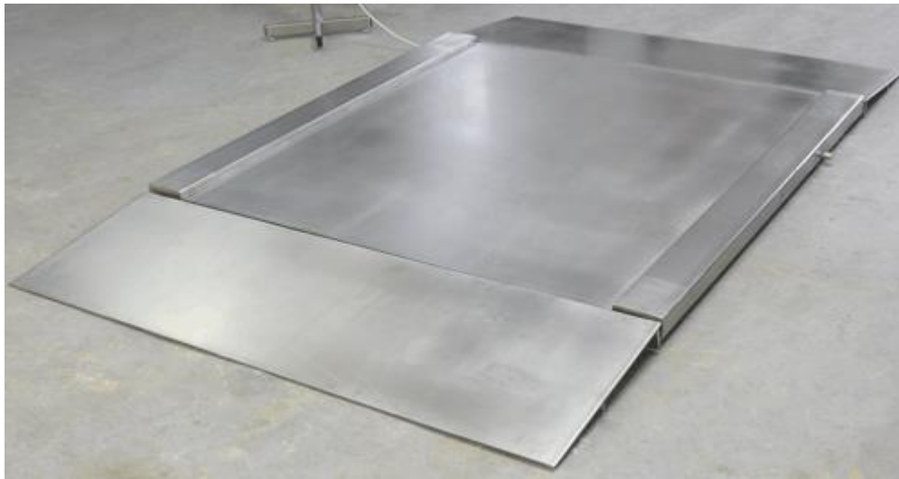
Imagen de la balanza de tránsito calibrada de acero inoxidable con dos rampas. La segunda rampa de acceso de acero inoxidable es opcional (ver los accesorios)