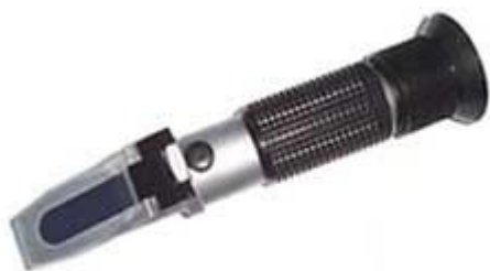
Aparato para refrigerante o anticongelante, productos de limpieza, ... Refractómetro PCE-SG

Con este refractómetro puede determinar el contenido de anticongelante en sus instalaciones y máquinas de un modo rápido y preciso. Podrá utilizar este refractómetro tanto en el ámbito de la industria como en el del sector del automóvil. Ponga un poco de líquido en el prisma, cierre la tapa y lea a continuación en la escala si tiene la cantidad de anticongelante necesaria para el líquido que haya seleccionado. Si no tiene suficiente cantidad, aumente la dosis y vuelva a realizar una nueva medición con el refractómetro. Si tiene preguntas sobre el refractómetro para refrigerantes consulte la siguiente ficha técnica, use nuestro formulario de contacto o llámenos: 902 044 604 para España, para Latinoamérica e internacional +34 967 513 695 o en el número +56 2 29381530 para Chile. Nuestros técnicos e ingenieros le asesorarán con mucho gusto sobre este refractómetro y sobre cualquier producto de nuestros sistemas de regulación y control , equipos de laboratorio , medidores o las balanzas de PCE Ibérica S.L.