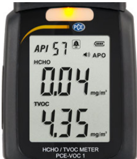
Pantalla del medidor PCE-VOC 1