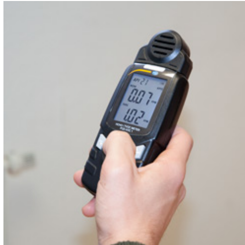
Pantalla del medidor COV durante su uso