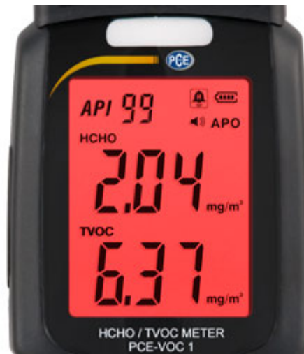
El medidor PCE-VOC 1 en modo alarma