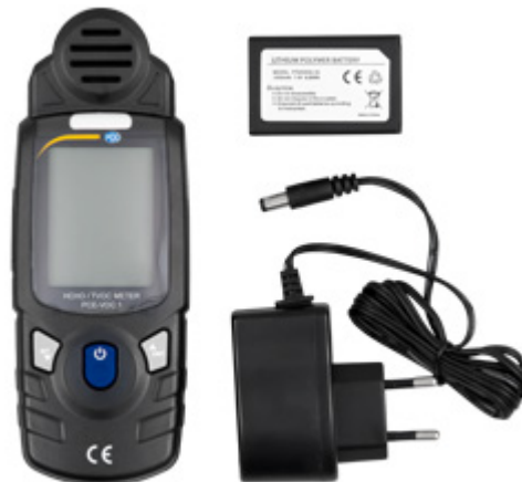
Contenido de envío del medidor PCE-VOC 1