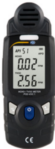
Vista completa del medidor COV