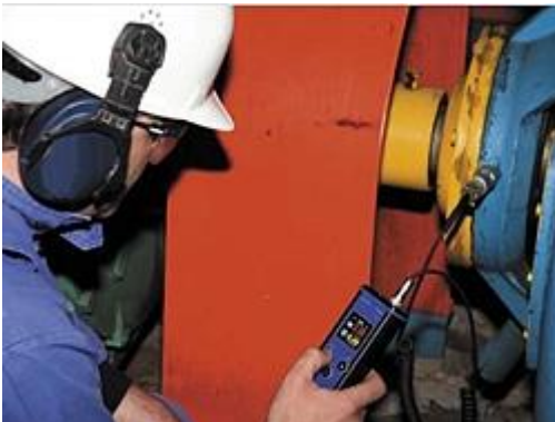
El PCE-VT 250D le permite diagnosticar el estado de sus máquinas y rodamientos