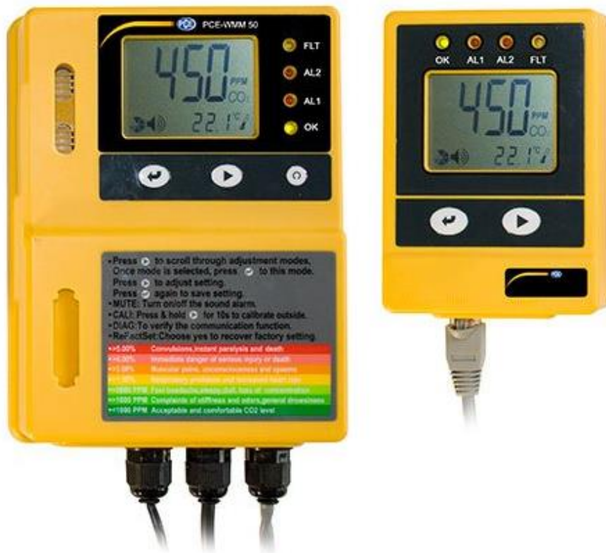
Detector de gas (CO 2 ) PCE-WMM 50

PCE Ibérica S.L. | Mayor 53 – Bajo | 02500 Tobarra (Albacete) Tel: +34 967 543 548 | Fax: +34 967 543 542 | Email: info@pce-iberica.es http://www.pce-iberica.es/