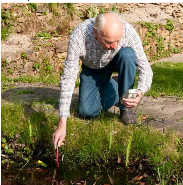
Imagen de uso del medidor de potencial Redox PCE-228R