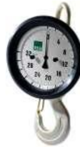
Balanza de gancho mecánica en forma de soporte de tracción (forma 1)