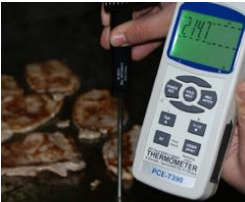
Realizando una comprobación de la temperatura en una plancha con el termómetro PCE-T 390