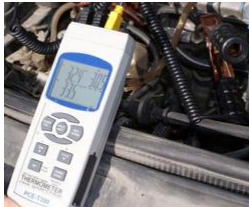
Midiendo la temperatura del motor de un coche con el termómetro y una sonda de varilla.